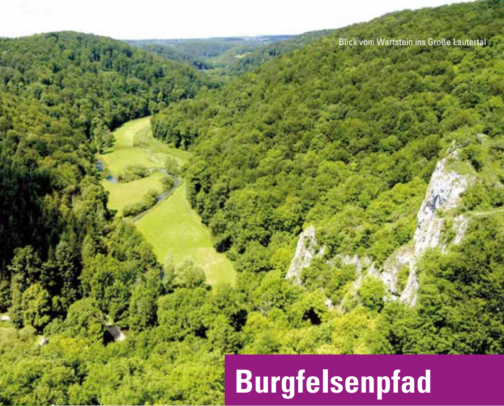
Blick vom Wartstein ins Große Lautertal

Alte Burgen und Ruinen lassen erahnen, wie es sich im Mittelalter gelebt hat. Schon damals wussten die Edelleute, wo die schönsten Plätze sind. Diese Tour ist von großem landschaftlichem Reiz, erfordert allerdings etwas Trittsicherheit und Kondition.