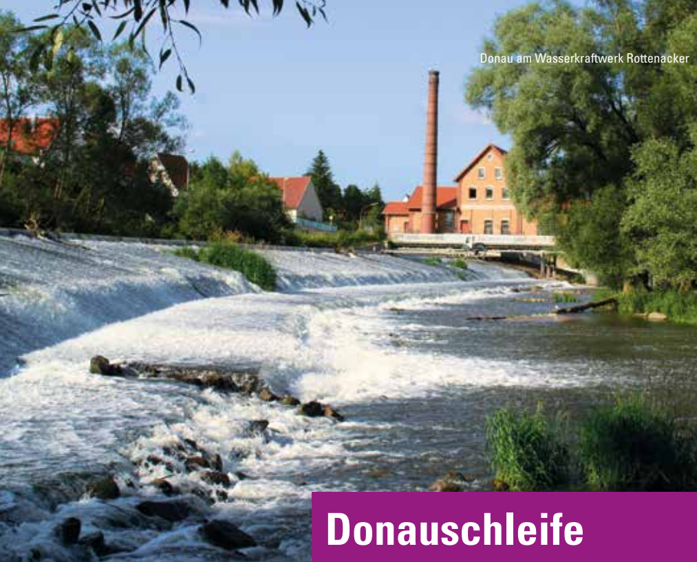
Donau am Wasserkraftwerk Rottenacker

An einer Flussschleife der Donau liegt das reizvolle Städtchen Munderkingen, unser Ausgangspunkt. Wir gehen stadtauswärts bergan zur Grelletlinde auf den Benkesberg und wandern auf einem aussichtsreichen Höhenzug am Rand des Donautals entlang in Richtung Neudorf. Über Feldwege geht es bergab nach Rottenacker und schließlich wieder zur Donau.