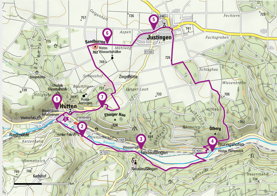
Pumpwerk bei Teuringshofen