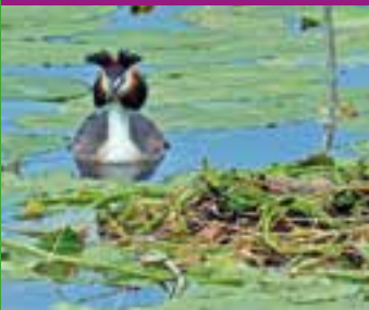
See bei Donaurieden