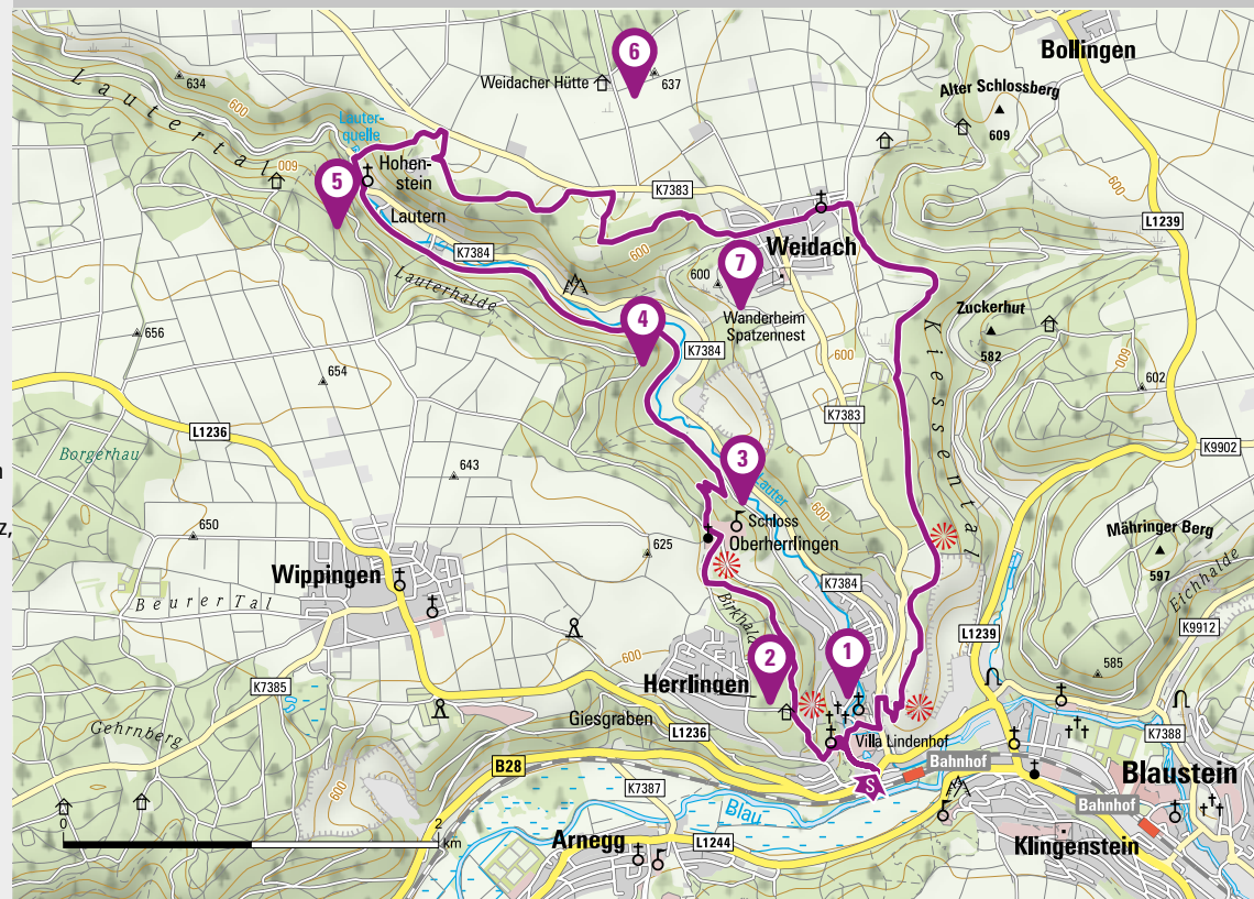
An der Lauter

Wander- und Ausflugsziel mit Einkehrmöglichkeit, Spiel- und Grillplatz (März bis Nov. Sonn- und Feiertage, Sommerferien auch Mo-Fr, s. Internet)