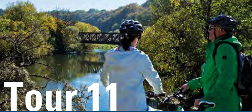
An der Donau in Rechtenstein

Selten ist eine Landschaft so reich gefüllt mit Kirchen, Klöstern, schmucken Dörfern und Städten wie Oberschwaben. Abwechslungsreich geformt durch die Gletscher der Eiszeit und mittendrin die Flussschleifen der Donau. Auf dieser Tagestour lassen sich also jede Menge kulturelle Schätze entdecken: Schloss Mochental im Kirchener Tal, das herrliche Barockkloster Obermarchtal an der Donau, die Wallfahrtskirche auf dem Bussen und zuletzt Oberstadion mit seinem historischen Dorfkern und dem einzigartigen Krippenmuseum. Bahnschlüsse in Ehingen, Rechtenstein und Riedlingen.