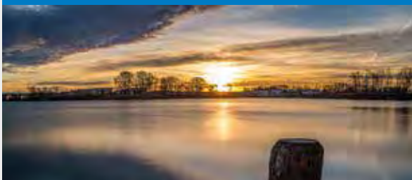
See bei Erbach