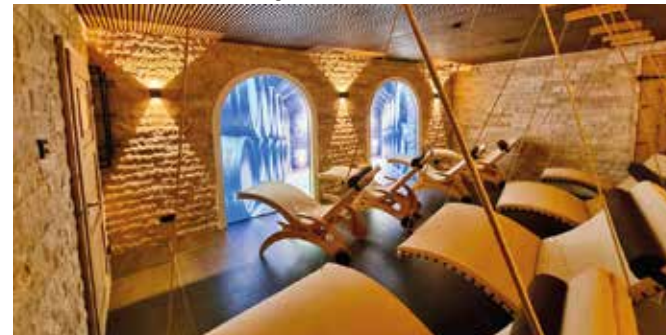
Erholung im Bier-Wellnessbereich

»Willkommen in der Bierkulturstadt Ehingen! Mit ihren fünf Traditionsbrauereien hat sich Ehingen über die Region hinaus einen Namen gemacht.