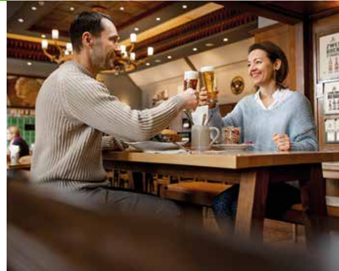
Genussvolle Einkehr nach Bierwanderung