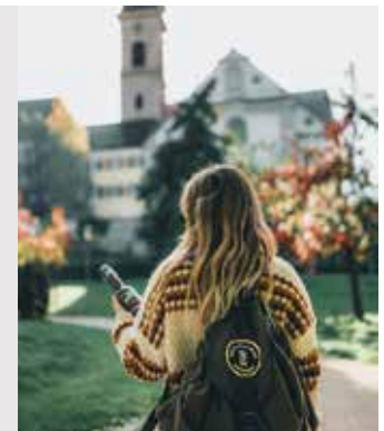
Gut versorgt auf dem Bierwanderweg mit dem ausleihbaren Wanderrucksack

Entdecken kann man diese Bierkultur-Tradition an zahlreichen Orten der Stadt, bei einer facettenreichen Bierwanderung, einer sportlichen Fahrradtour auf der Berg Bier-Tour oder bei einem der zahlreichen Erlebnisangebote. An welchem Ort ließe sich sonst Bier selber brauen, das Traditionshandwerk und die Bierproduktion hautnah kennenlernen, zahlreiche kulinarische Biergerichte verkosten oder einen Bier-Wellnessbereich genießen?