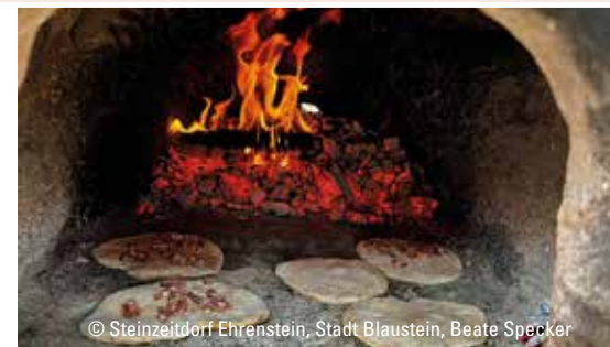
© Steinzeitdorf Ehrenstein, Stadt Blaubeuren, Beate Specker