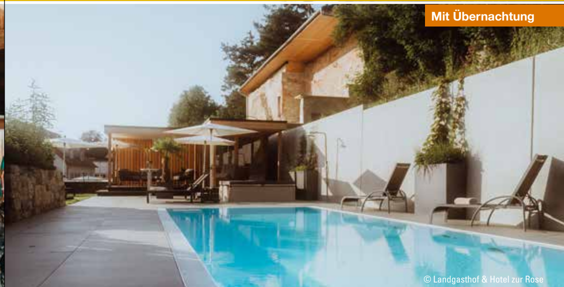
© Landgasthof & Hotel zur Rose

Tel. 07391 500460 info@adlerehingen.de | www.adlerehingen.de