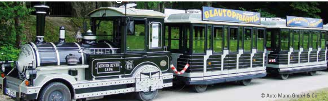
© Auto Mann GmbH & Co.