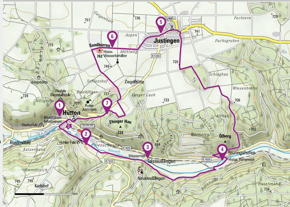
Pumpwerk bei Teuringshofen

7 Steige auf der alten Wegstrecke führen früher die Bauern mit Ochsenkarren das Wasser in Fässern auf die Alb