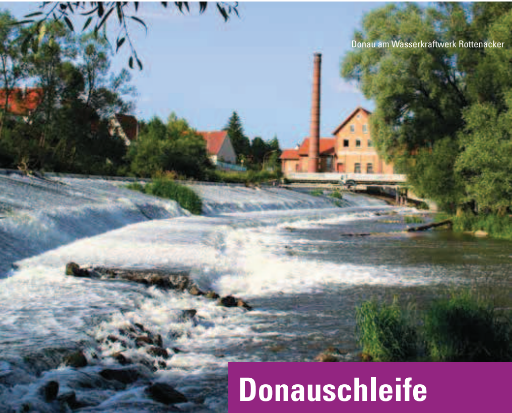
Donau am Wasserkraftwerk Rottenacker

An einer Flussschleife der Donau liegt das reizvolle Städtchen Munderkingen, unser Ausgangspunkt. Wir gehen stadtauswärts bergan zur Grelletlinde auf den Benkesberg und wandern auf einem aussichtsreichen Höhenzug am Rand des Donautals entlang in Richtung Neudorf. Über Feldwege geht es bergab nach Rottenacker und schließlich wieder zur Donau.